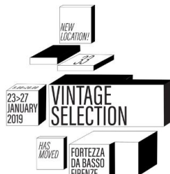
VINTAGE SELECTION No. 33