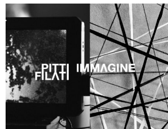
PITTI FILATI N.84 WHERE FASHION RESEARCH BEGINS